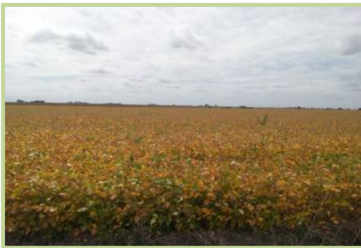
Foto tomada el 19/03/2013 en zona rural al norte de la localidad de Cruz Alta.

Maíz en el Departamento San Justo: lote de fecha de siembra tardía, en estado general muy bueno. Los maíces se encuentran en estado fenológico R3 (grano lechoso).