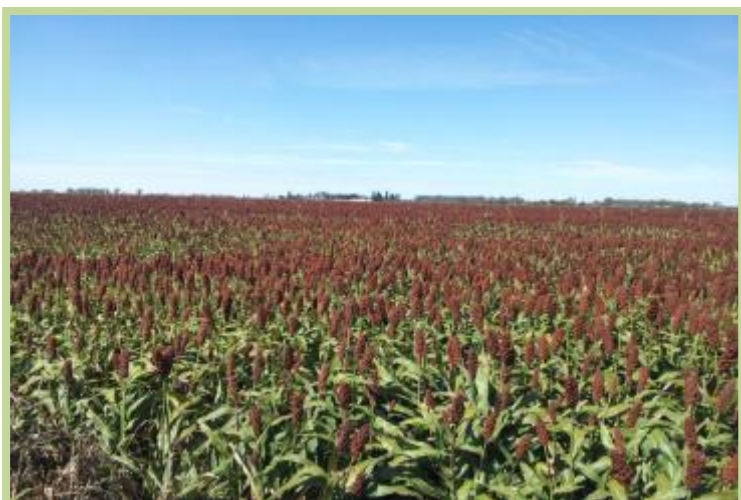
Foto tomada el 18/03/2013 en la localidad de Wenceslao Escalante, sobre ruta provincial N° 3.

Soja en el Departamento San Justo: en secano en estado de inicio llenado de granos.