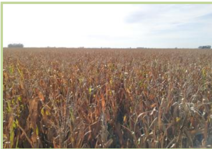
Foto tomada el 19/03/2013 en la localidad de Corral de Bustos, sobre ruta provincial N° 12.

Maíz en el Departamento Marcos Juárez: Un 60% se encuentra en estado de madurez avanzada próxima a cosecha. Prueba de cosecha en algunos lotes, pero sin avance aún de la labor.