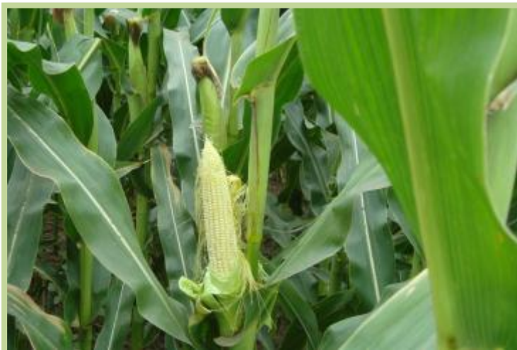
Foto tomada el 15/03/2013 en zona rural a 9 km al norte de la localidad de Tránsito.

Maíz en el Departamento Marcos Juárez: Un 60% se encuentra en estado de madurez avanzada próxima a cosecha. Prueba de cosecha en algunos lotes, pero sin avance aún de la labor.