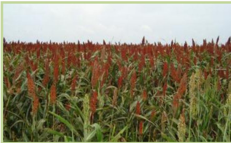
Foto tomada el 14/03/2013 en zona rural de la localidad de Colonia Marina.

Sorgo en el departamento Unión: Los lotes se encuentran en grano pastoso y en buenas condiciones sanitarias.