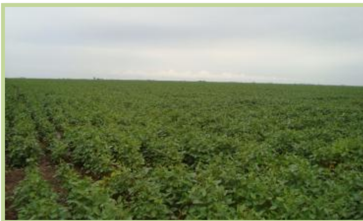
Foto tomada el 14/03/2013 la zona rural de la localidad de Colonia Marina.

Soja en el Departamento San Justo: en secano en estado de inicio llenado de granos.