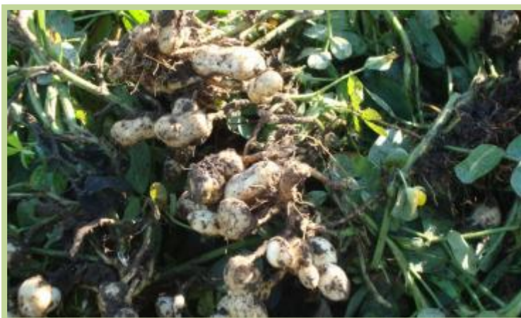
Foto tomada el 15/03/2013 en la localidad de Calchín sobre ruta provincial N°13.

Maní en el Departamento Río Segundo en estado fenológico de R4-R5 (caja completa-comienzo de llenado semilla).