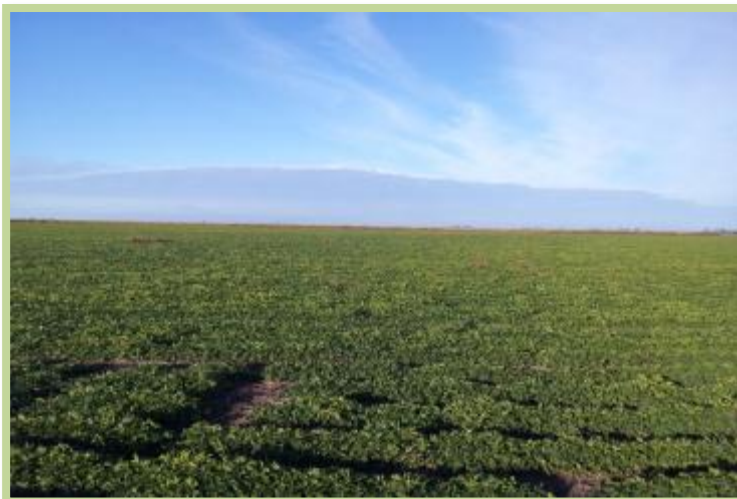
Foto tomada el 18/03/2013 entre las localidades de Laguna Larga y Manfredi, sobre autopista N° 9.

Maní en el Departamento Río Segundo en estado fenológico de R4-R5 (caja completa-comienzo de llenado semilla).