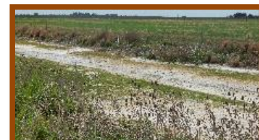
Foto tomada el 14/10/2016: salinidad presente al lado de la ruta nacional 158 a 8km al Noreste del pozo del molle localidades de (Dpto. San Justo).