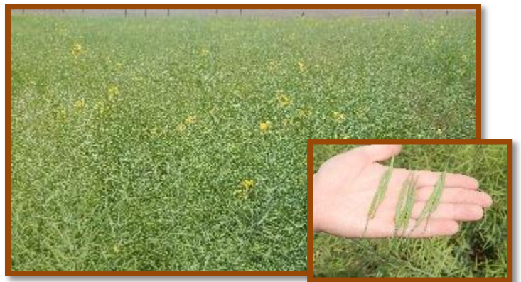
Foto tomada el 14/10/2016 a 5 km al Oeste de la localidad de Las Varillas, Dpto. San Justo.

Colza. Estado general Muy bueno – Excelente. Fenología: Comienzo llenado de granos. No se observaron plagas y enfermedades