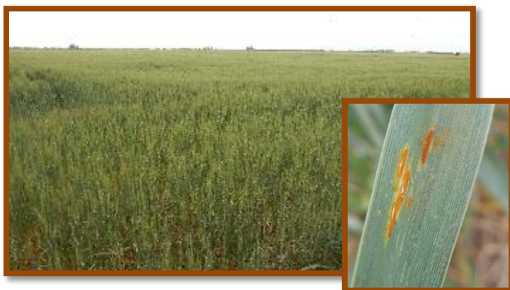
Foto tomada el 13/10/2016 a 8 km al Noreste de la localidad de La Paqueta, Dpto. San Justo.

Trigo. Estado general Muy Bueno. Fenología: Antesis. Se observó presencia de roya.