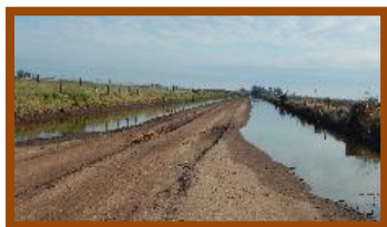
Foto tomada el 14/10/2016: camino rural a 8km al Norte de Devoto (Dpto. San Justo).

Los cultivos están atravesando el período crítico durante el presente mes. Las precipitaciones ocurridas el día 4 de Octubre mejoró el estado general de aquellos cultivos que venían expresando la falta de agua en los primeros centímetros del perfil, según lo reportado por nuestra red de colaboradores. Por otra parte se pudieron observar lotes anegados, caminos intransitables y sal en superficie (caminos y bajos naturales).