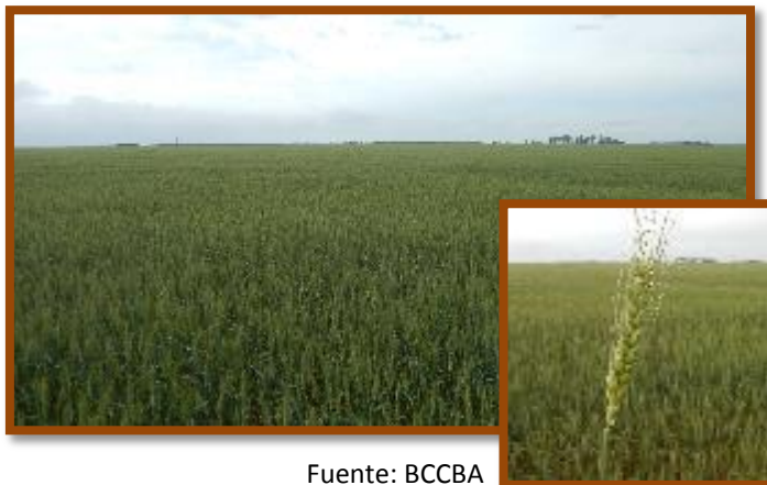
Foto tomada el 13/10/2016 a 9 km al Norte de la localidad de Villa Concepción del Tío, Dpto. San Justo.

Trigo. Estado general Muy Bueno. Fenología: Grano lechoso. No se observaron plagas y enfermedades.