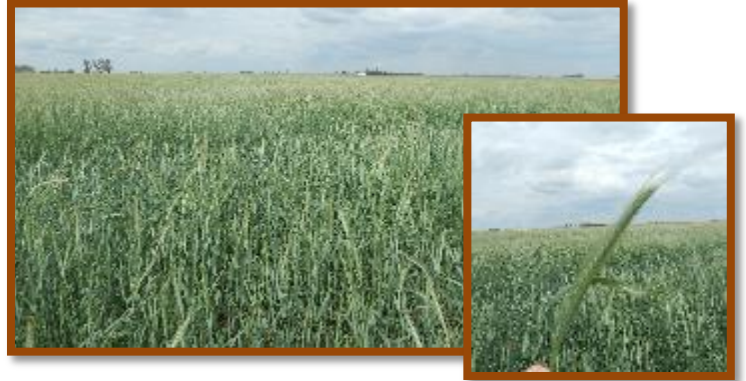
Foto tomada el 14/10/2016 a 5 km al Oeste de la localidad de Las Varillas, Dpto. San Justo.

Centeno. Estado general Muy Bueno. Fenología: Antesis. No se observaron plagas y enfermedades.